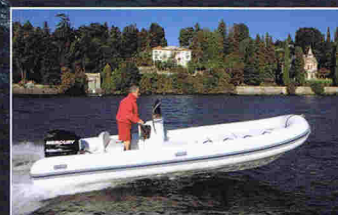
BLACK FIN 585