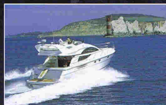
FAIRLINE PHANTOM 50