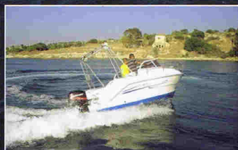
ITALMAR FISHING 500